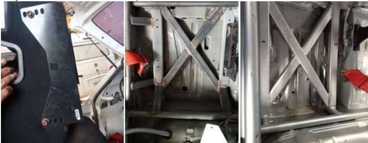
Suporte do Banco (Fixação Lateral) / Prolongamento Santo Antonio p/ fixação do banco

Se forem utilizados bancos com regulagem, o mesmo deverá ser fixado conforme artigo 16 do anexo "J" da FIA com calhas de aço e chapas de no mínimo 3mm, com fixações e travas eficientes. Exemplos fotos abaixo: