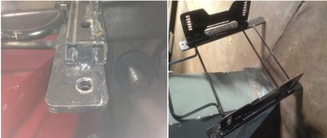
Suporte do Banco com regulagem (Sugestão)